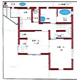
1階平面図・配置図